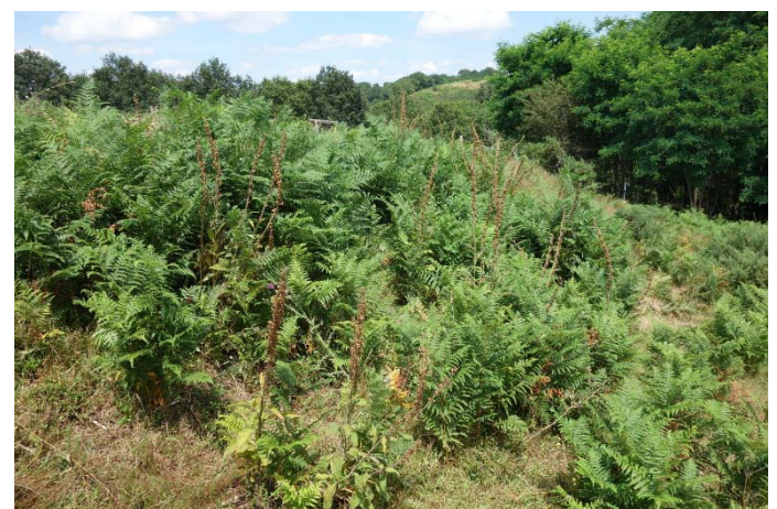
Végétation du relevé n°16