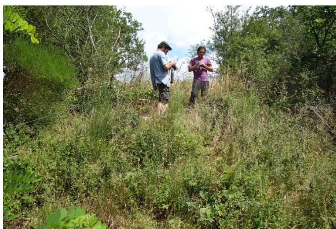
Végétation du relevé n°17