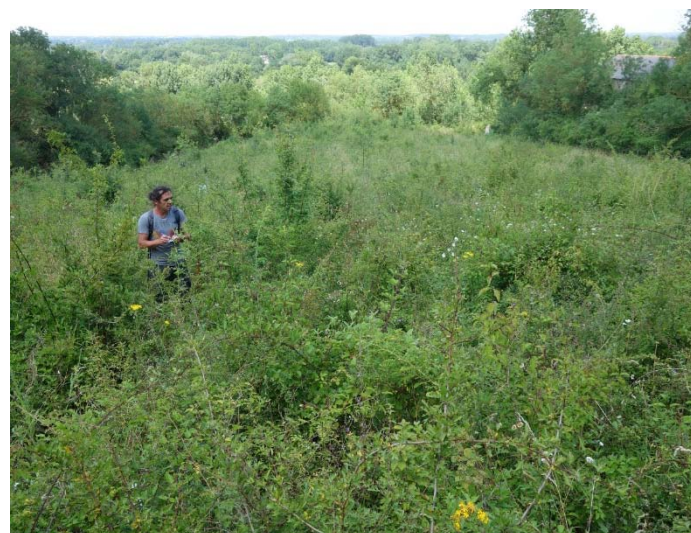
Végétation du relevé n°6