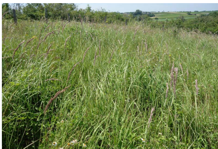
Végétation du relevé n°1