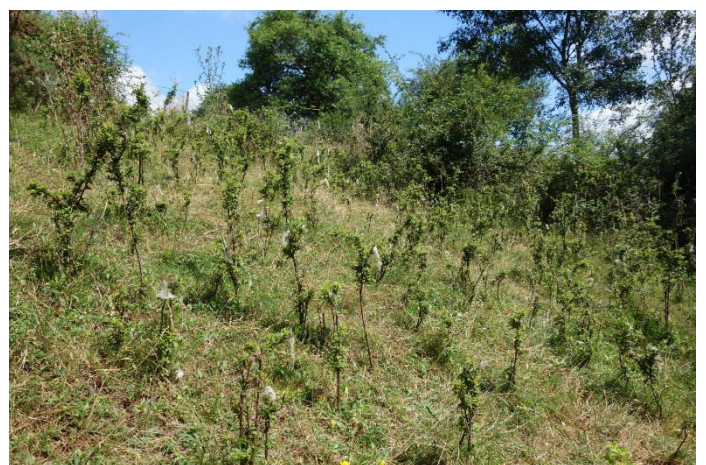
Végétation du relevé n°10