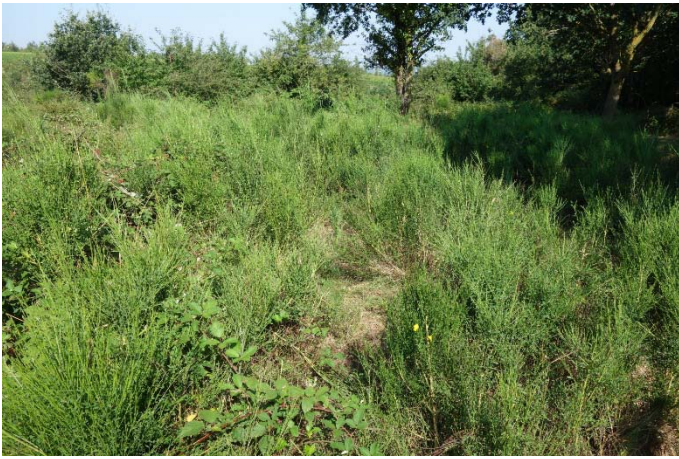
Végétation du relevé n°20