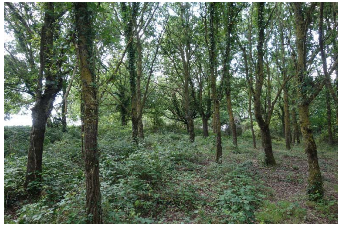
Végétation du relevé n°21