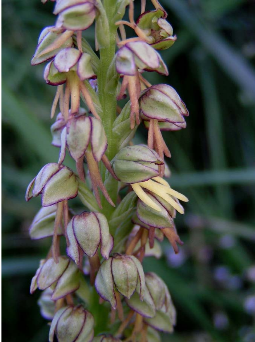
Orchis anthropophora (L.) All., 1785, catégorie UICN NT (quasi menacé)

Mots-clés : végétation, dynamique, gestion, agropastoralisme, restauration.