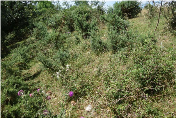
Végétation du relevé n°11