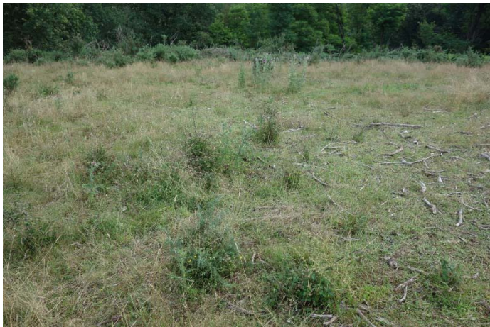
Végétation du relevé n°13