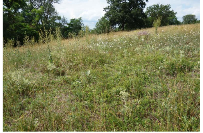
Végétation du relevé n°19