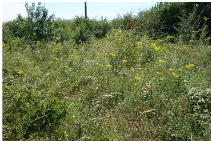
Végétation du relevé n°4