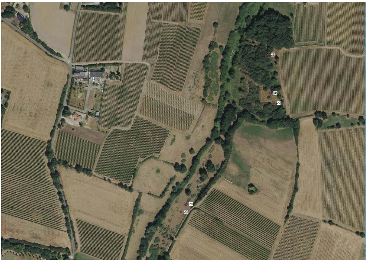
Figure 3 : Site 2 : Vallon du Vaujou à la Pommeraye (rel. 20 à 24) – date de prospection : 12/07/2018