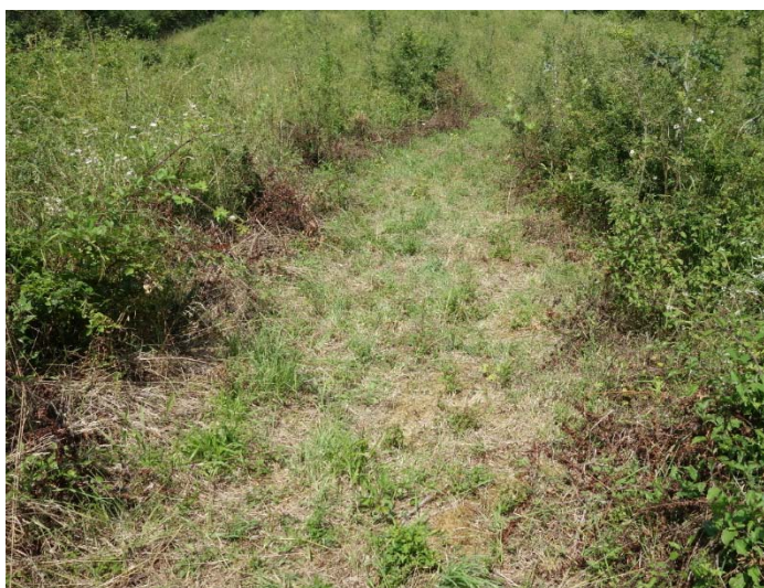
Végétation du relevé n°5