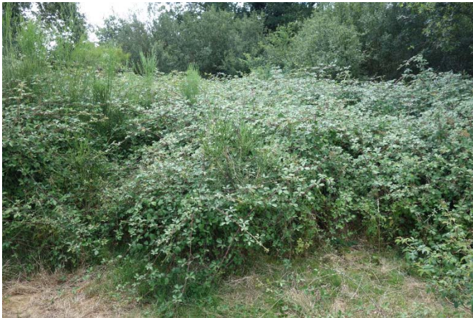
Végétation du relevé n°22