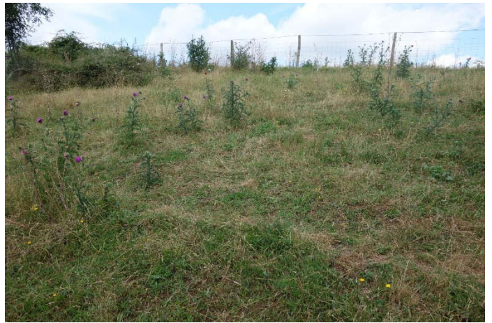
Végétation du relevé n°12