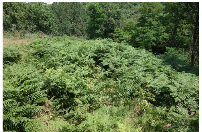
Végétation du relevé n°14