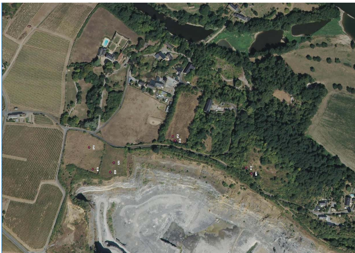
Figure 2 : Site 1 : Châteaupanne à Montjean-sur-Loire (rel. 1 à 8) – date de prospection : 29/06/2018