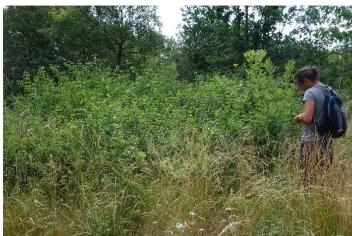
Végétation du relevé n°7