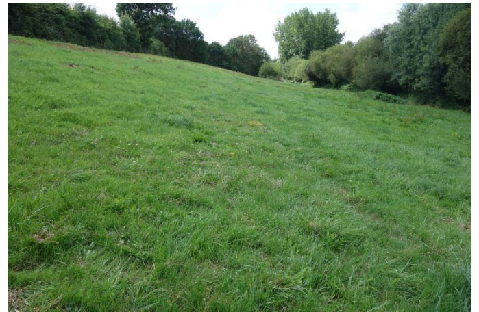
Végétation du relevé n°23