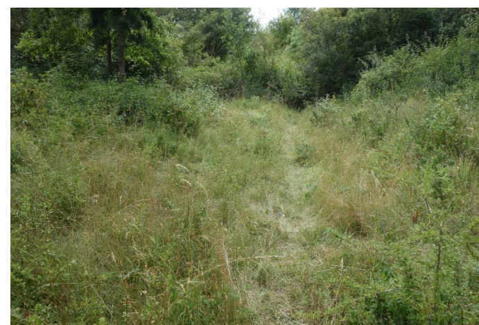
Végétation du relevé n°8