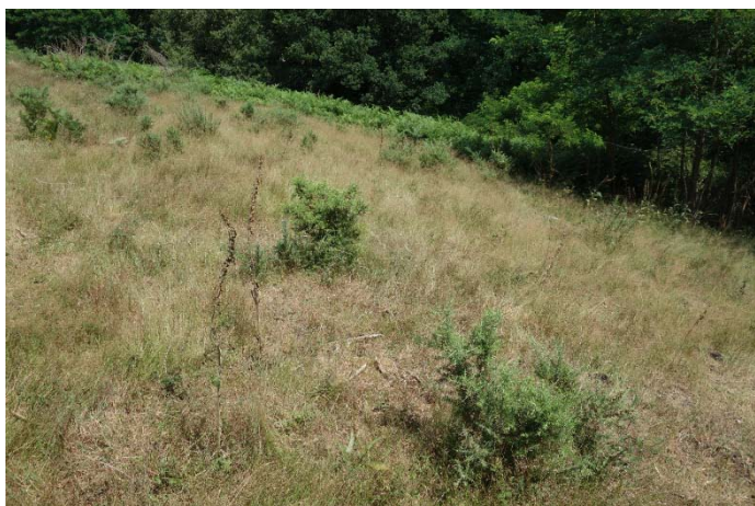
Végétation du relevé n°15