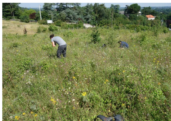
Végétation du relevé n°2