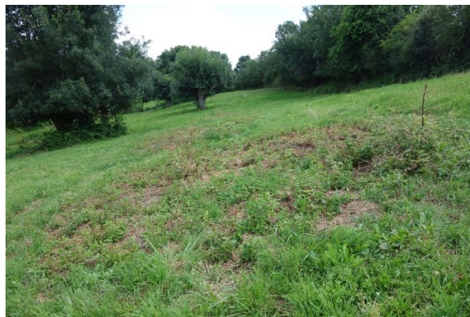
Végétation du relevé n°24