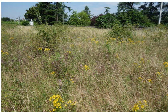
Végétation du relevé n°3