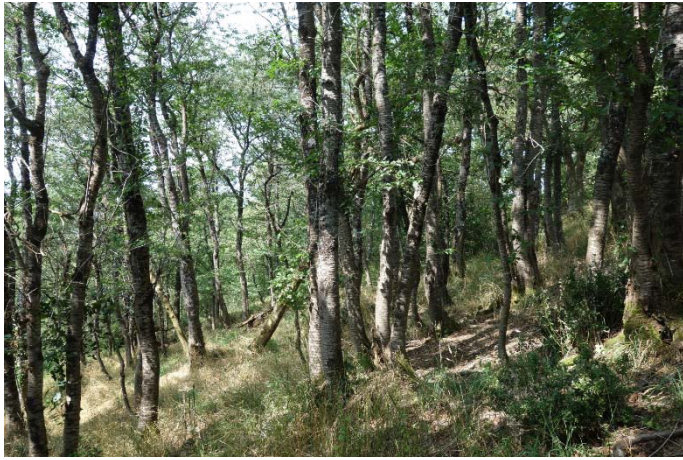
Végétation du relevé n°18