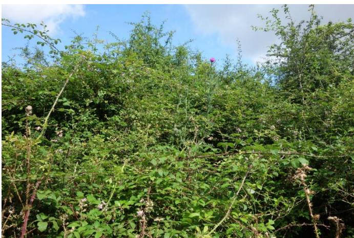
Végétation du relevé n°9