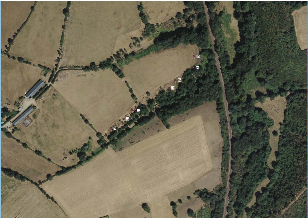
Figure 4 : Site 3 : Le Masureau à Chaudesfond-sur-Layon (rel. 9 à 16) – date de prospection : 04/07/2018