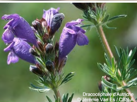
Dracocéphale d'Autriche