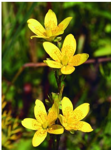
Saxifrage œil-de-bouc Saxifraga hirculus L.