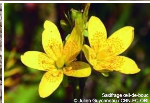
Saxifrage œil-de-bouc