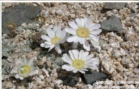
Marguerite tomenteuse