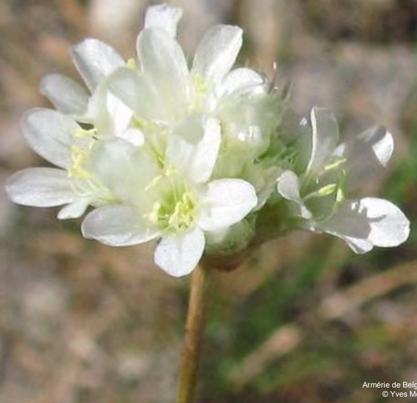
Armérie de Belgentier