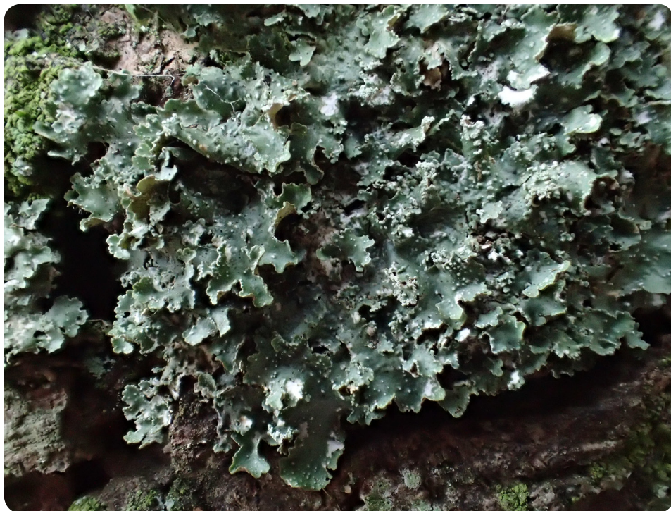
Figure 5. Punctelia reddenda , l'une des quelques espèces pour lesquelles on dispose d'indices d'une nette augmentation depuis les années 1930 • J.-Y. Monnat