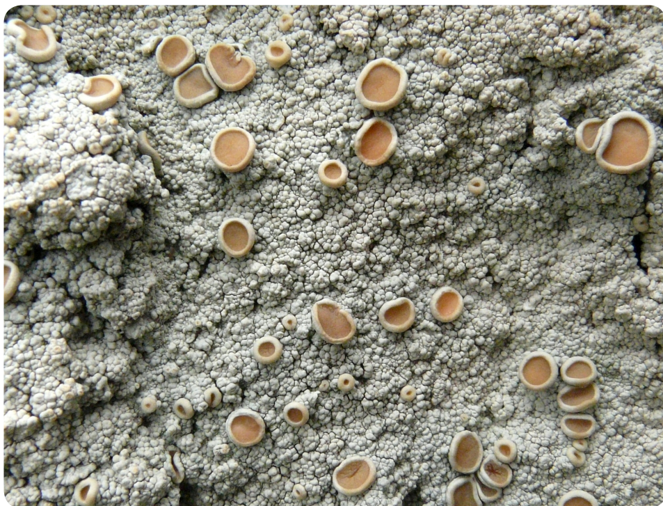
Figure 6. Commun sur les rochers littoraux et de l'intérieur jusqu'aux années 1960, Ochrolechia tartarea s'est beaucoup raréfié depuis