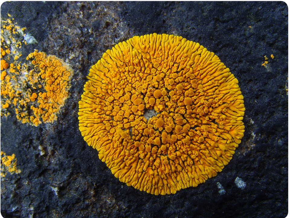
Figure 2. Ici associé à Hydropunctaria maura (noir), Caloplaca thallicola est l'un des taxons les plus caractéristiques de l'étage supralittoral • J.-Y. Monnat