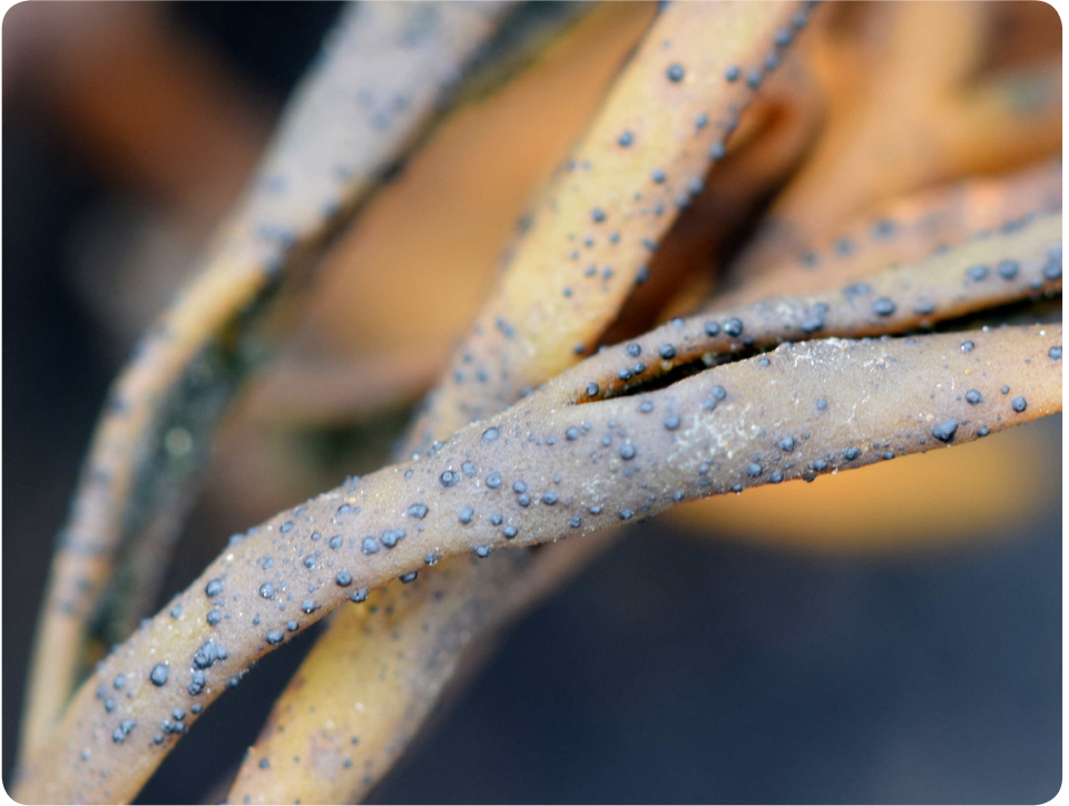
Figure 1. Collembosporium pelvetiae , espèce très discrète de l'étage médiolittoral, à la base des frondes de l'algue Pelvetia canaliculata dans les zones abritées • M.A. Esnault