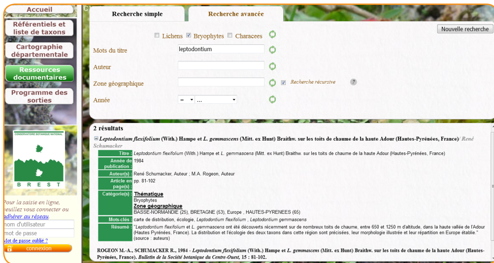
Figure 4. Interface dédiée à la consultation de références bibliographiques (titres des références et, parfois, des contenus)