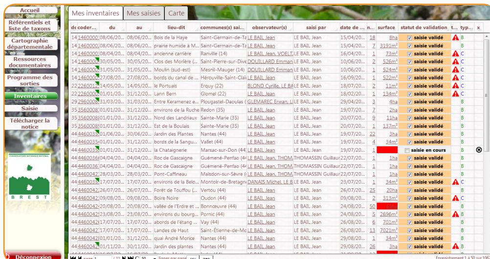
Figure 5. Interface dédiée à la consultation de données d'inventaires

Ces deux interfaces sont opérationnelles pour les données de bryophytes et de lichens ; elles doivent être finalisées pour les données de charophytes, en lien avec le protocole d'inventaire de ce groupe de taxons, qui sera arrêté et à tester prochainement.