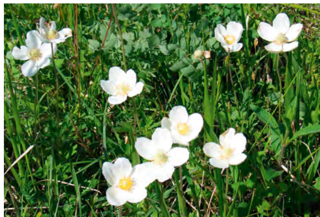
■ L'Anémone sauvage ( Anemone sylvestris ), classée en catégorie "Quasi menacée"