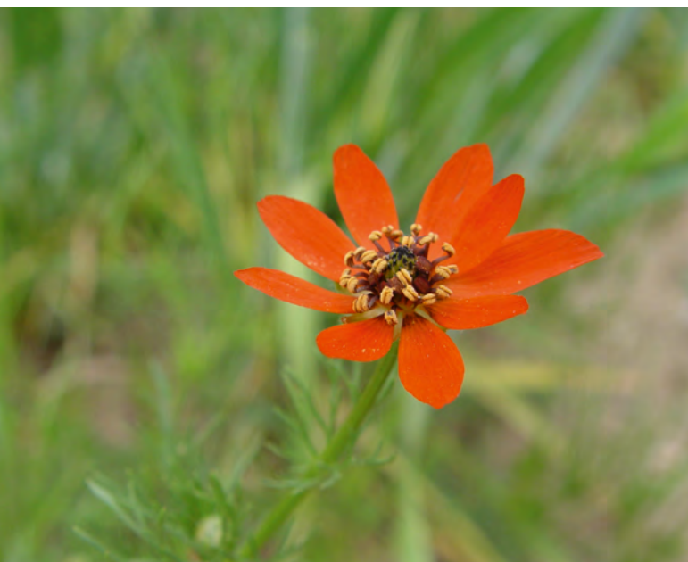
■ L'Adonis couleur de feu ( Adonis vernalis ), une espèce "Quasi menacée" et en déclin

L'état des lieux mené dans le cadre de la Liste rouge nationale a porté sur l'ensemble de la flore vasculaire du territoire métropolitain, afin de mesurer le degré de menace pesant sur chacune des espèces et sous-espèces.