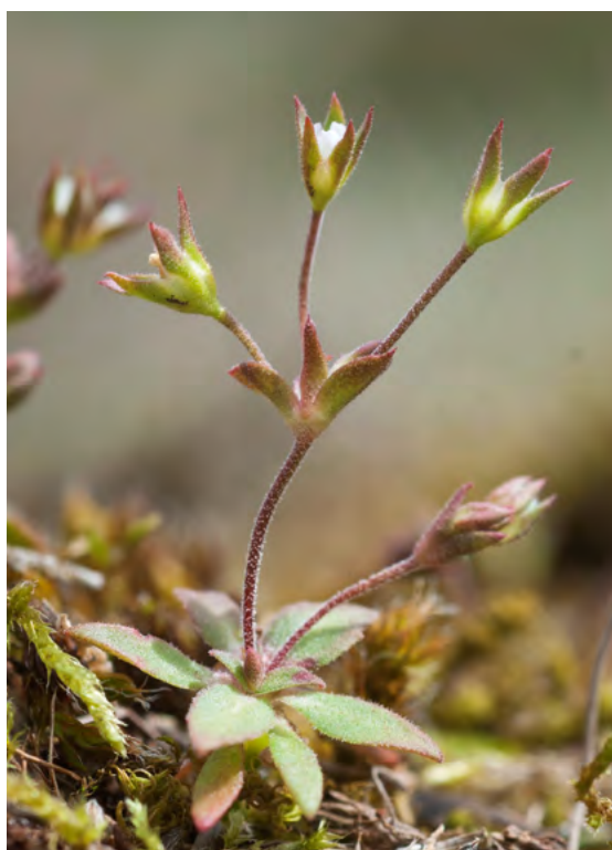
■ L'Androsace allongée ( Androsace elongata ), en déclin et classée "Vulnérable"