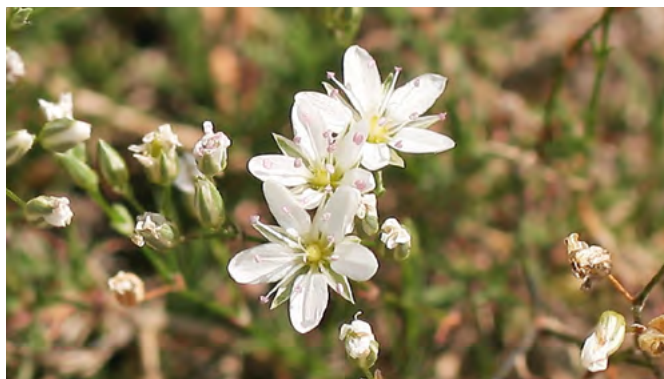
■ L'Alsine sétacée ( Minuartia setacea ), en déclin et classée dans la catégorie "En danger"

Les pressions touristiques telles que la surfréquentation et le piétinement intense affectent également des espèces comme l'Astragale de Marseille, classée "En danger", ou la Nananthée minuscule, "Quasi menacée". Et des pratiques de loisirs comme l'escalade touchent des plantes de montagne telle que la Benoîte à fruits divers, classée "En danger critique".