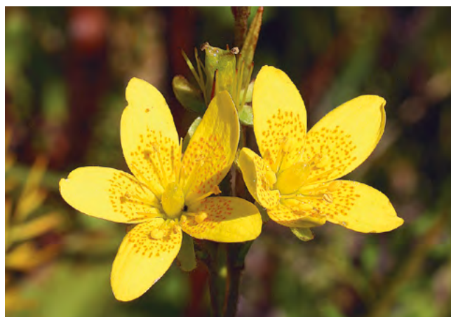
■ La Saxifrage œil-de-bouc ( Saxifraga hirculus ), une espèce "En danger critique"