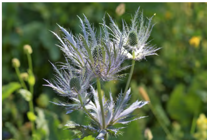
■ Le Panicaut des Alpes ( Eryngium alpinum ), en déclin et classé "Quasi menacé"

* X : espèce endémique de France métropolitaine.