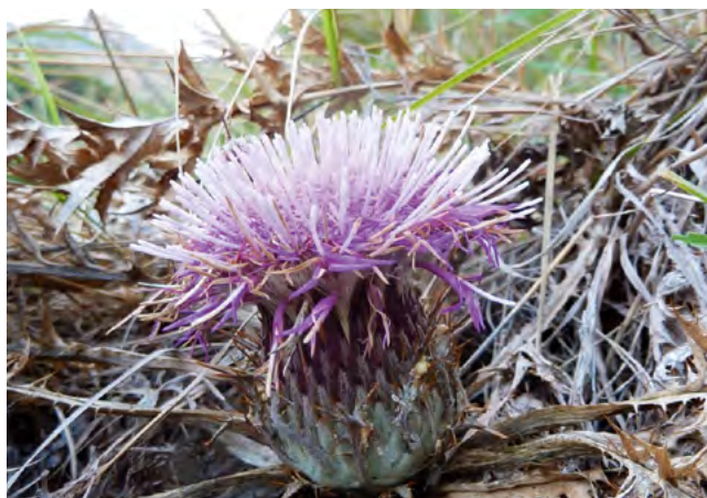
■ La Carlina à gomme ( Carlina gummifera ), disparue de France métropolitaine

* X : espèce endémique de France métropolitaine.