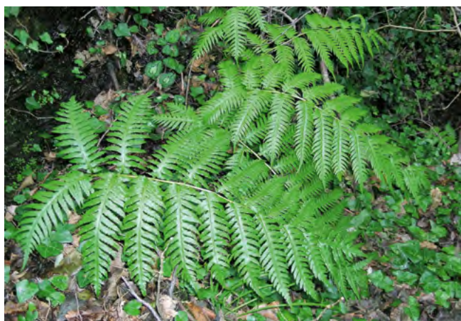
■ La fougère Woodwardia radicans ( Woodwardia radicans ), classée "En danger"