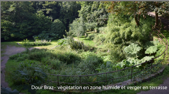
Dour Braz- végétation en zone humide et verger en terrasse

Brest.fr/au quotidien/agir pour l'environnement/les espaces verts/balades urbaines