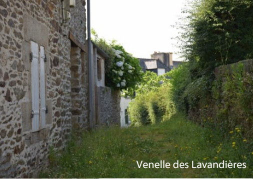
Venelle des Lavandières