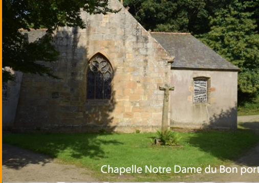
Chapelle Notre Dame du Bon port

Depuis 2018, les espaces naturels de la rampe du Vieux Bourg sont entretenus deux fois /an par une vingtaine de brebis de race Scottish Black Face, réputée pour son caractère paisible et sa très bonne résistance aux intempéries. Complémentaire au travail des jardiniers/jardinières, ce mode de gestion permet aussi une gestion naturelle des espèces végétales invasives et contribue à restaurer la biodiversité de ces milieux.