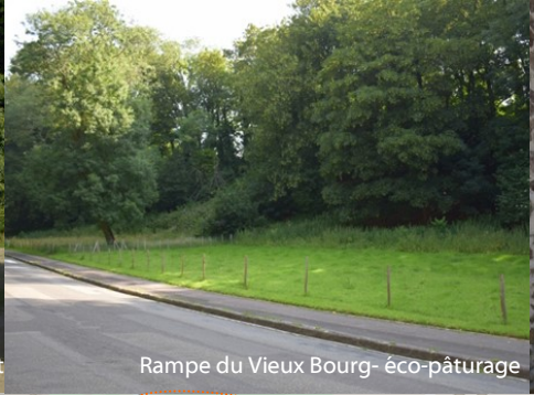
Rampe du Vieux Bourg- éco-pâturage