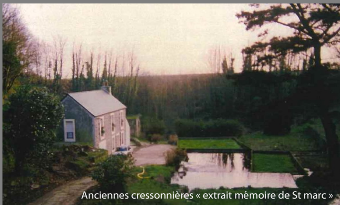
Anciennes cressonnières « extrait mémoire de St marc »

Accessible par la rue Gounod ou du Brigadier le Cann, le jardin du Dour Braz offre un espace de verdure qualifié de petit bois. Vous y trouverez une végétation semi-aquatique variée. Les gunneras, arums, fougères sont implantés dans la zone humide du jardin, autrefois anciennes cressonnières.