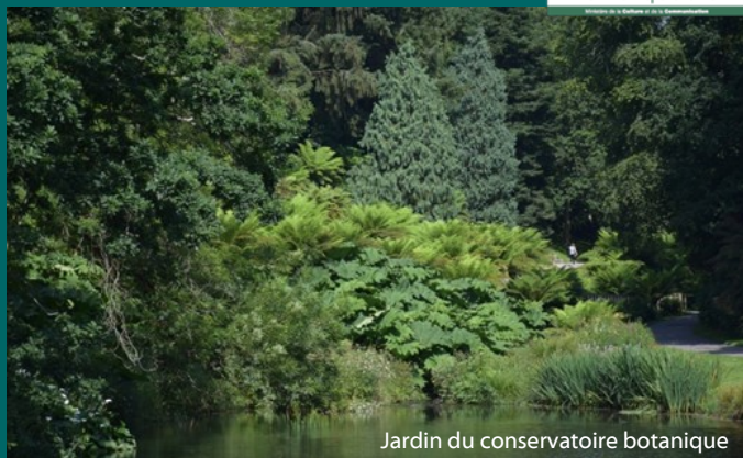
Jardin du conservatoire botanique