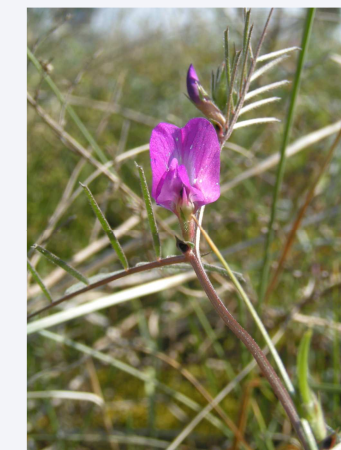
V. angustifolia L. [V. sativa subsp. nigra (L.) Ehrh.]

Folioles des f. sup. à L/l normalement > 10 (et bords parallèles) dents du calice* gen. ≥ 75% du tube (sur les fleurs inf.), subulées dans leur moitié apicale, à 3 nerv. coalescentes à partir de la mi-longueur étendard rouge purpurin éclatant, de même teinte que les ailes ; gousses noircissant précocement à maturité