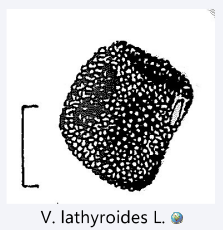
V. lathyroides L.

Graines papilleuses corolles bien développées ≤ 9 mm de long feuilles supérieures majoritairement à 2-3 paires de folioles vrilles toutes simples