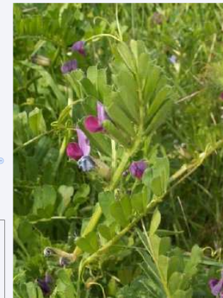
V. sativa L. subsp. sativa.

Gousse* nettement toruleuse graines mûres blanchâtres à brun ocracé dents du calice plus longes que le tube. 4-9 graines par gousse