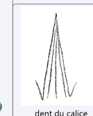
dent du calice