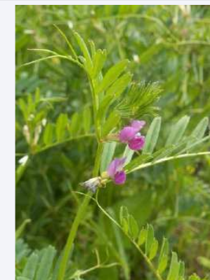
V. segetalis Thuill. [V. sativa subsp. segetalis (Thuill.) Čelak.]

Folioles des f. supérieures à L/l normalement < 10 dents du calice* gen. ≤ 75% du tube (sur les fleurs inf.), étroitement triangulaires, à 3 nerv. restant bien distinctes → près de l'apex étendard souvent mauve et nettement plus clair que les ailes, plus rarement rouge purpurin gousses brunissant ou noircissant tardivement à maturité