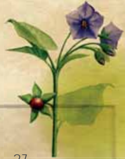
B- Normania triphylla