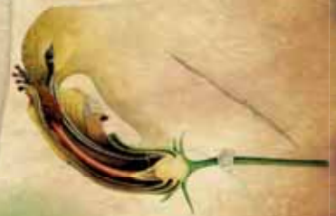
A- Hibiscadelphus giffardianus