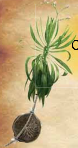
CH- Limonium dendroides