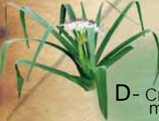
D- Crinum mauritianum