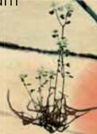
E- Drosera binata