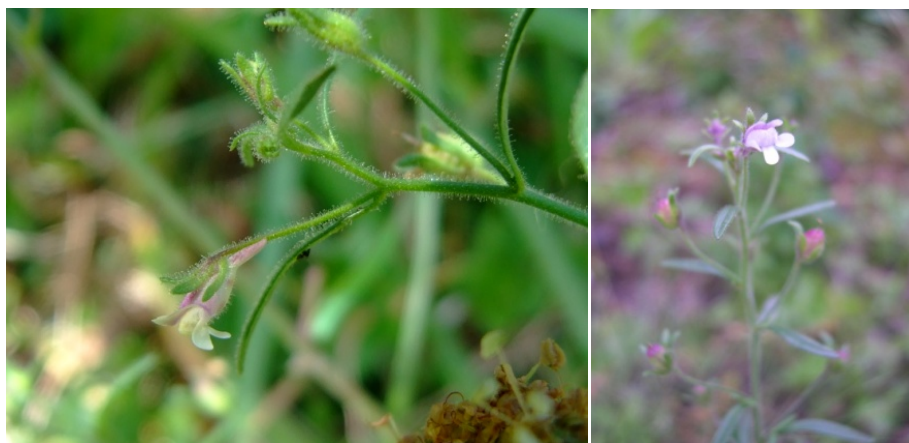
Petite Linaire • photos Jean Le Bail (CBN de Brest)