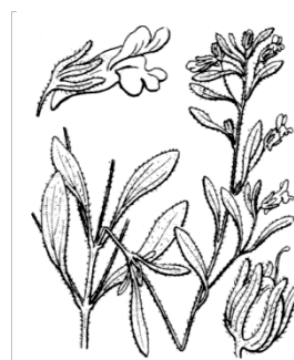
Petite Linaire • Illustration extraite de la flore de Coste

Fleurs petites (4-7 mm) violet pâle à éperon court et obtus, solitaires à l'extrémité des rameaux. Sépales pubescentes à lobes étroits, légèrement plus courtes que la corolle. Capsule ovoïde, plus courte que le calice, s'ouvrant par 2 pores.