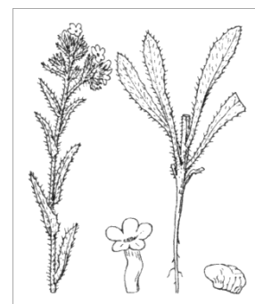
Buglosse des champs • Illustration extraite de la flore de Coste

Fleurs assez petites (7-9 mm) à 5 pétales bleu clair (rarement blanches ou rosées) et à gorge blanche, rappelant celles des myosotis. Elles sont groupées en bout de tige. Graines finement ridées et à petits tubercules.