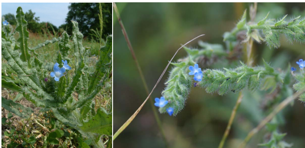
Buglosse des champs